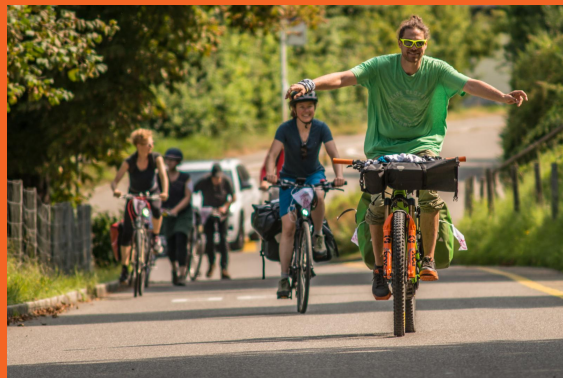
Campax Nationalbank-Velotour August/September 2021