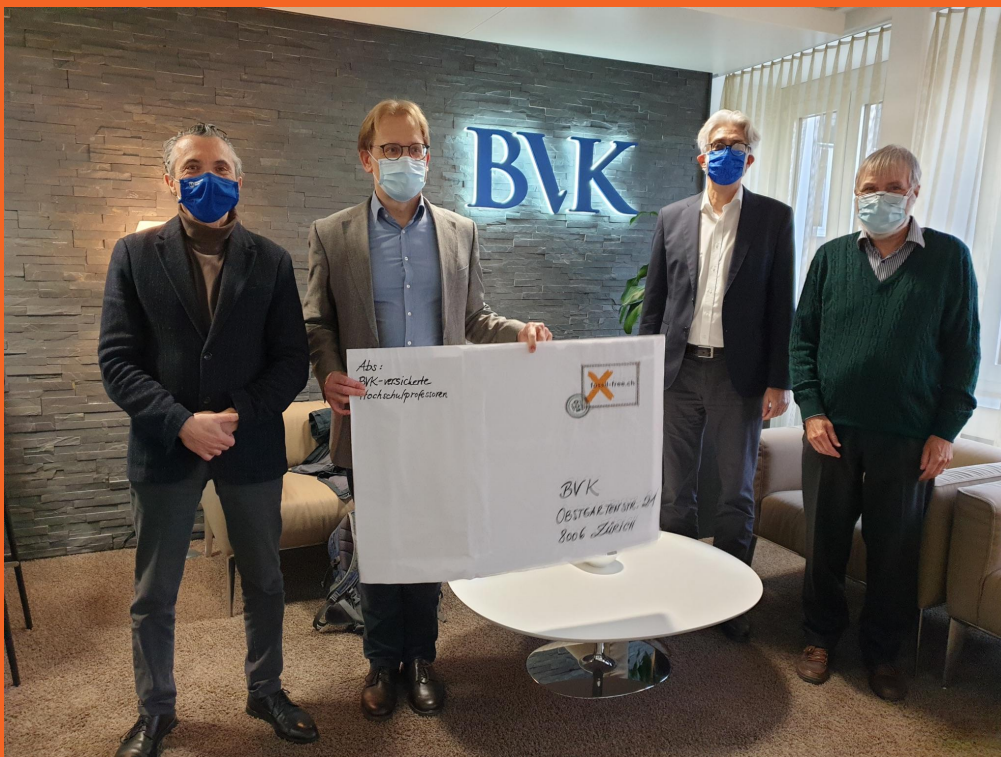
Übergabe Professorenbrief an Beamtenversicherungskasse BVK Zürich 11.12.2020